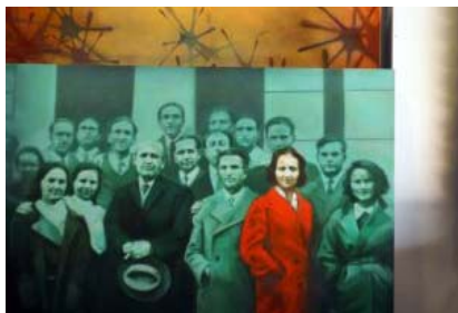
Treballs figuratius, retrats de celebritats, com les seues admirades María Zambrano i Hannah Arendt.